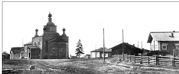
Так выглядела Николаевская церковь.