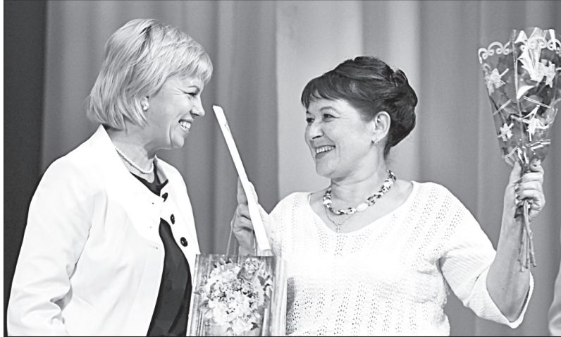
Министр здравоохранения РК Н. Арнаутова и В. Фролова.