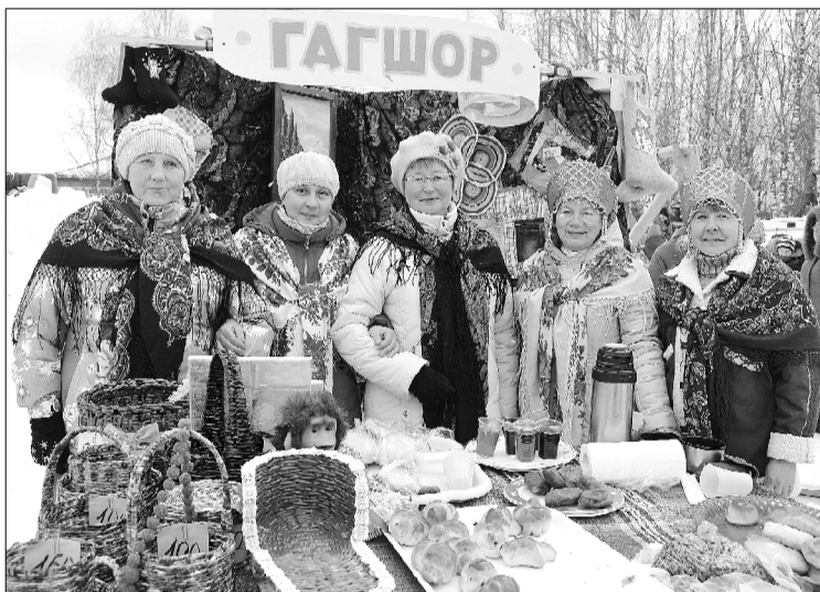
Подворье СП «Гагшор».