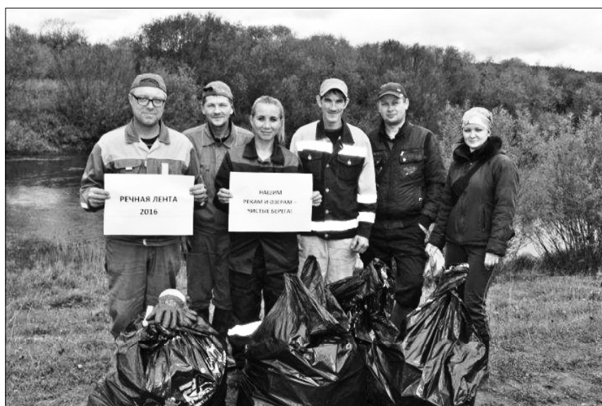
Участники акции на берегу реки Малой Визинги.

В ЦЕЛЯХ улучшения экологической обстановки на водных объектах и прибрежных территориях, привлечения внимания населения к экологическим проблемам республики, Управлением Росприроднадзора по Республике Коми и Министерством природных ресурсов и охраны окружающей среды Республики Коми проводится ежегодная республиканская экологическая акция «Речная лента».