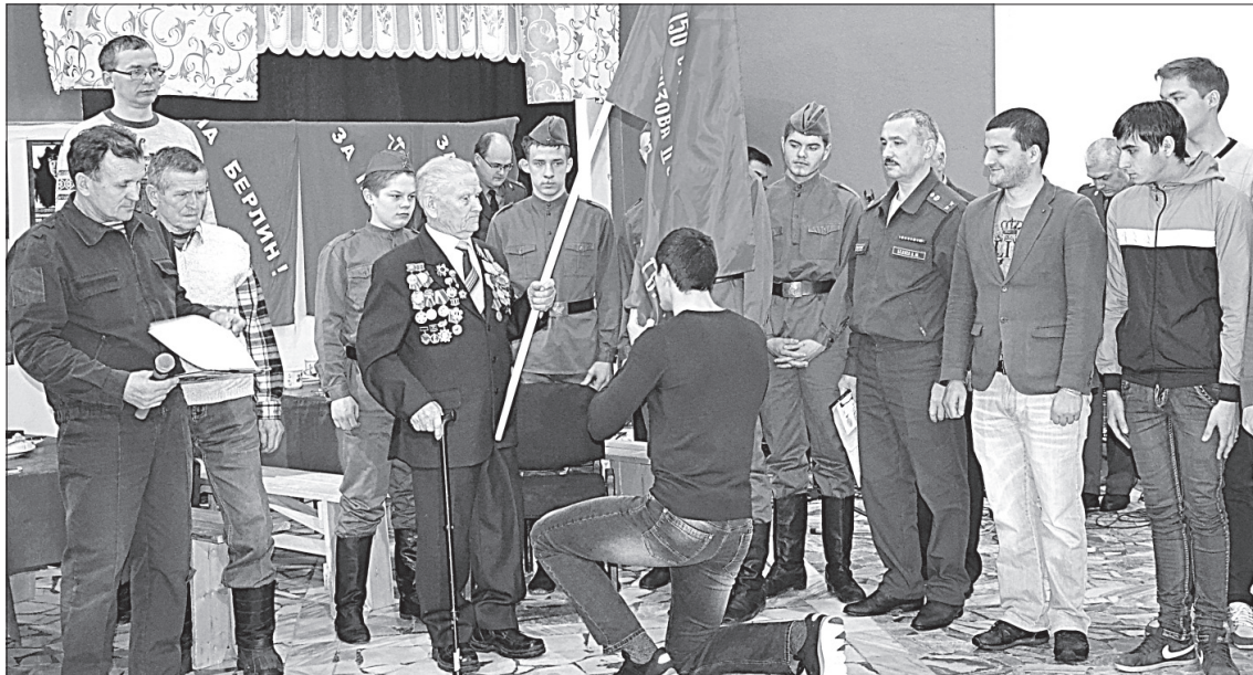
Передача Знамени Победы.

Просторный зал, где предстояло чествовать призывников, в оформлении соответствовал общей атмосфере праздничного события: растянутое вдоль перил полотнище российского триколора, баннер «За Родину» с фото-