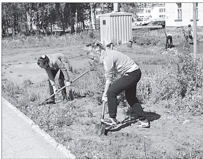
Школьники работают на благоустройстве села.