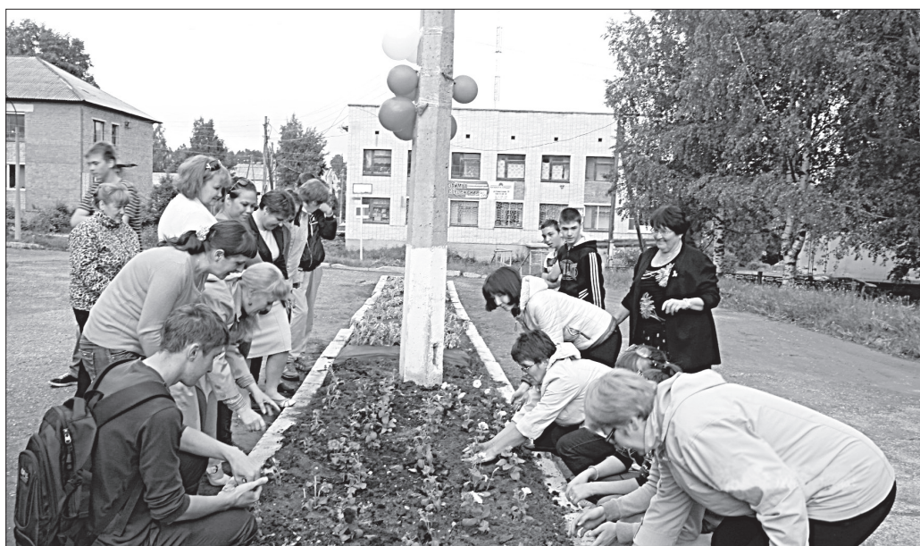
Участники акции оформляют клумбу.

В ПРЕДВЕРИИ Дня России студенты и педагогический коллектив Визингского филиала КРАПТ провели настоящую патриотическую акцию.