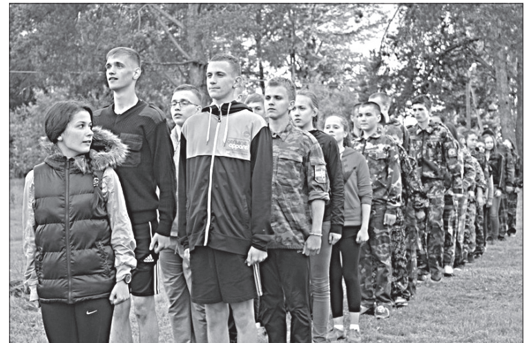
Участники патриотической смены.

В РЕСПУБЛИКЕ Коми в рамках Года патриотизма стартовала военно-патриотическая смена «Защитник», в которой принимают участие 60 воспитанников кадетских классов и школ с различных городов и районов региона.