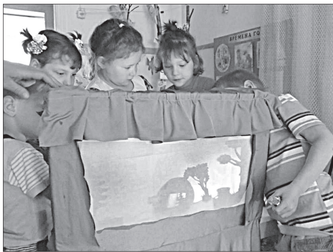
Дошкольники осваивают театр теней.