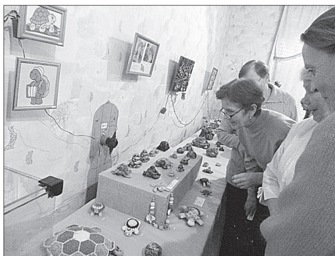
Первые посетители выставки.

Так как мероприятие прошло в завершение Года литературы в РФ, то далее гости встречи попали в ли-