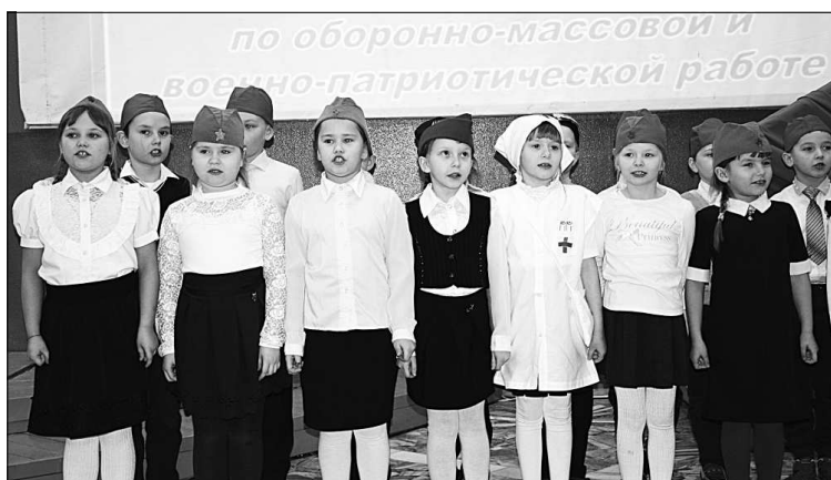
Выступление 1 «а» класса.

23 ЯНВАРЯ в районном Доме культуры состоялась церемония открытия месячника оборонно-массовой подготовки и патриотического воспитания, посвященный 100-летию Красной армии, 100-летию органов военного управления.