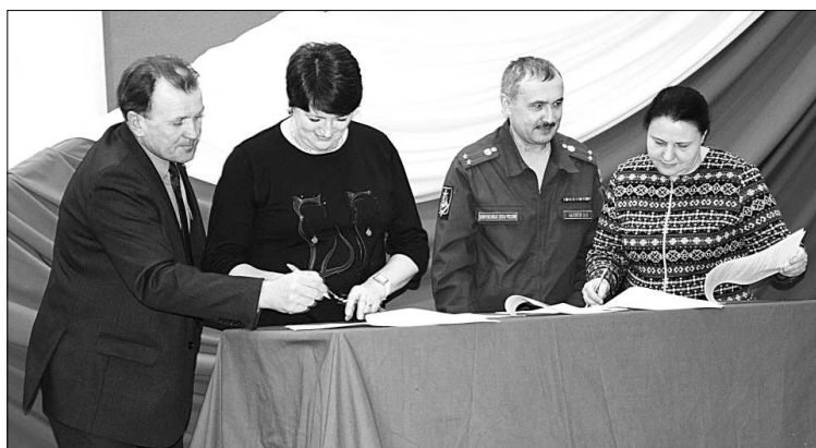
Подписание положения о конкурсе.