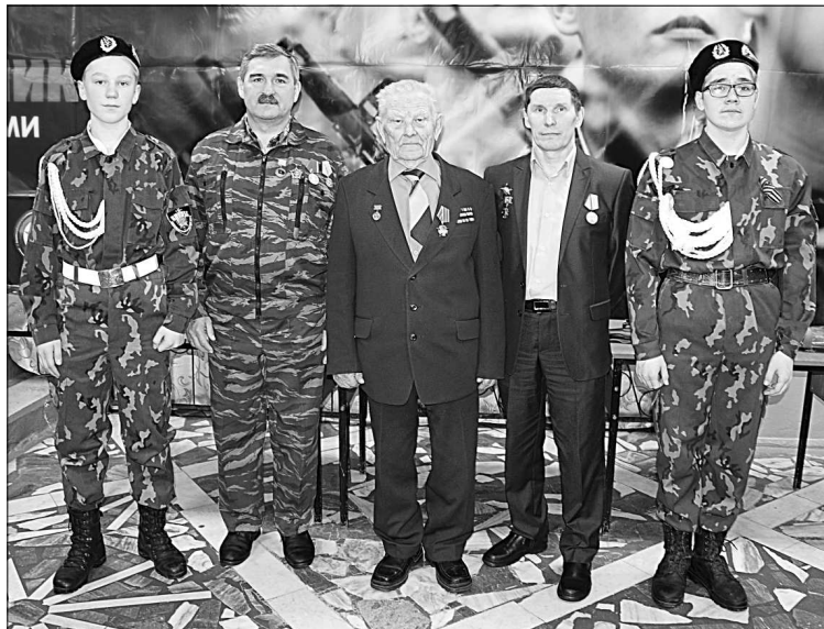
Три поколения защитников Отечества.