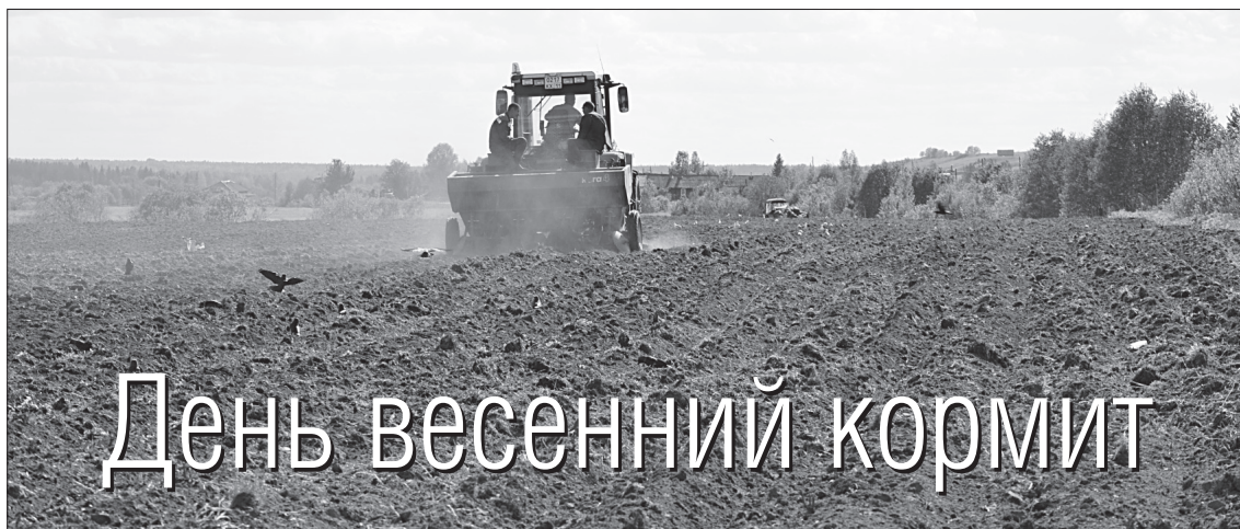
Идет посадка картофеля в ООО «Визинга».

АГРАРИИ района полным ходом ведут посевную кампанию.