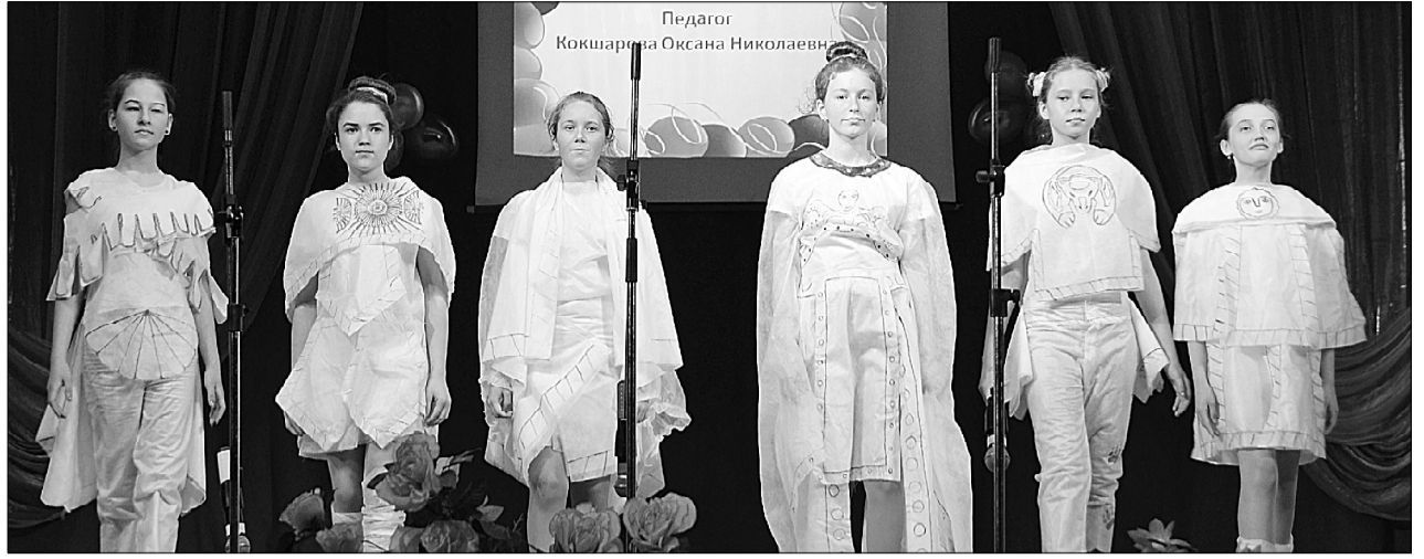
Показ этнофутуристической коллекции одежды.