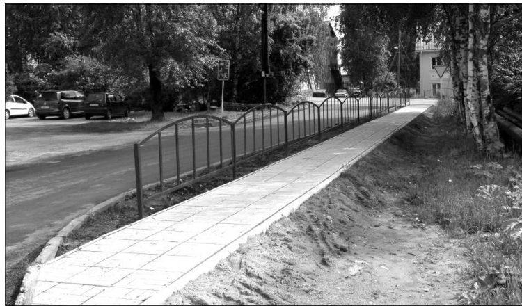
Новый тротуар возле «красной» школы.

Каждый из более 20 членов комиссии в соответствии с критериями ставил своё количество баллов, столько, сколько, по его мнению, достойно каждое муниципальное образование. Учитывался и анализ результатов стратегии социально-экономического развития РК за отчётный период, который готовился Минэкономразвития РК. Руководителем конкурсной ко-