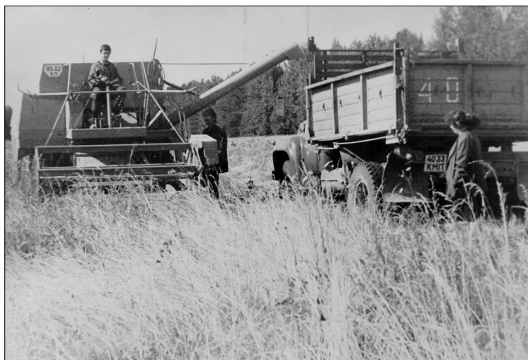
На поле сортоучастка.