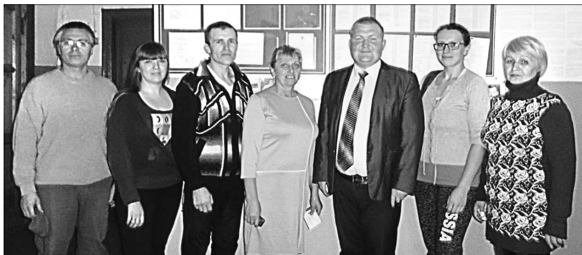
Депутаты сельского поселения «Чухлэм» четвертого созыва.