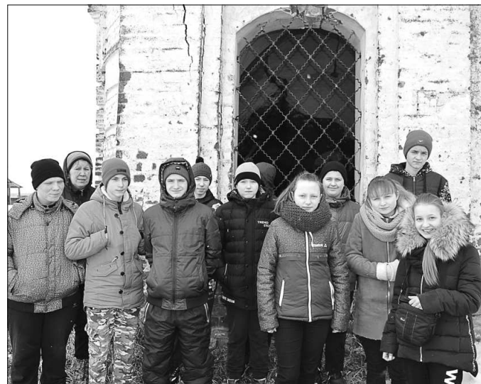
Учащиеся объединения «Ордым» в Вотче.

Также прошел практикум «Мой проект» на создание проектов по озеленению