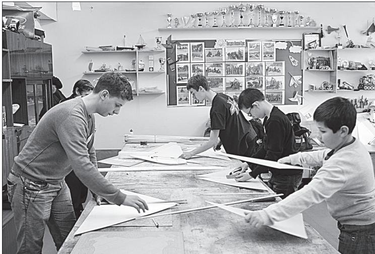
Мастер-класс по авиамоделированию.

2 ноября в кабинетах прошли мастер-классы по изготовлению моделей для зала. Стоит отметить, что некоторые из них проводили сами юные техники. После обеда состоялись испытательные полеты из-