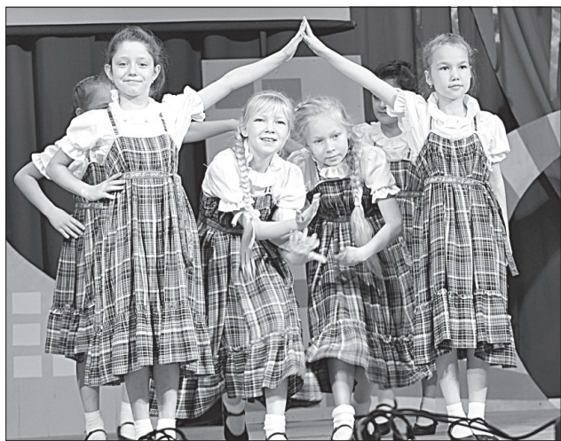
Младшая танцевальная группа «Катшасиньяс».