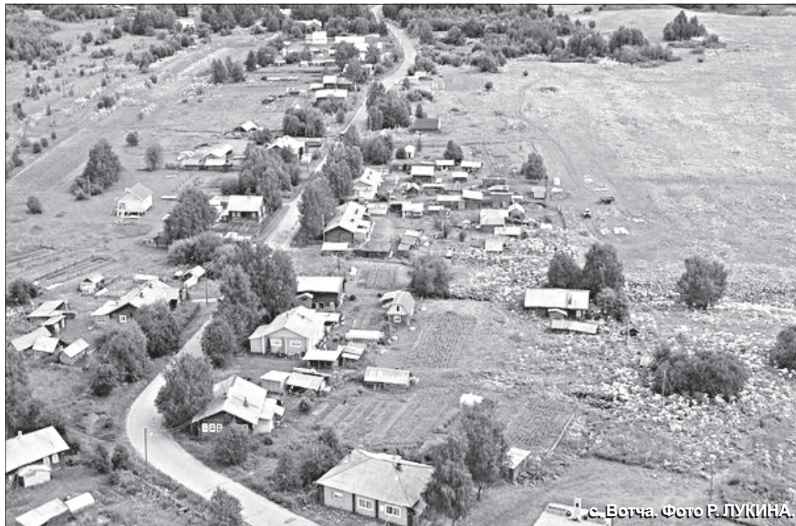
с. Вотча.