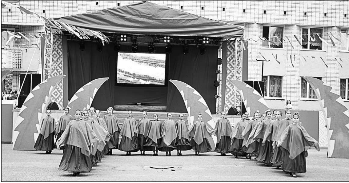
Театрально-хореографическая композиция «Легенда об одуванчике».