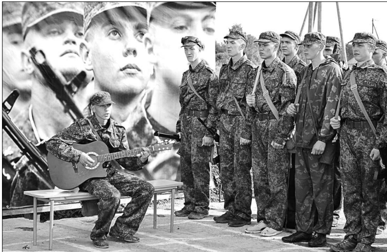
Участники конкурса «Лучший призывник-2017».

Но такому красивому финалу конкурса предшествовали непростые армейские будни.