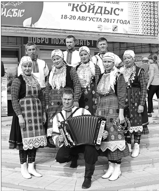
Победители фестиваля «Пинал даур».