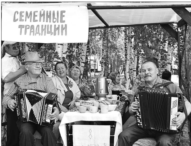
Деревня «Семейные традиции».