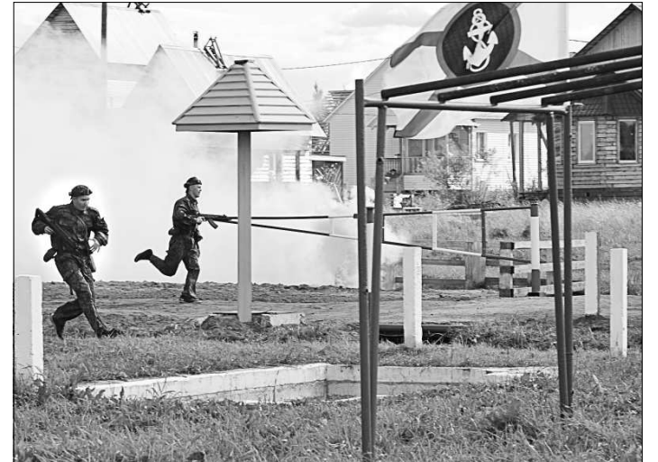
В разгаре боя.