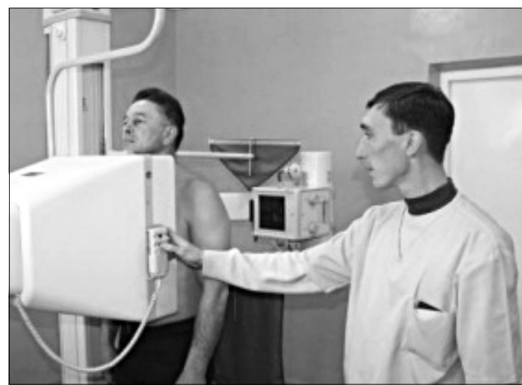
Флюорография - лучший способ выявления болезни.

нии туберкулёз излечим или удаётся продлить качественную жизнь заболевшего. Но для этого нужно и желание больного избавиться от болезни. Очень важное условие - моральная поддержка родных и близких.