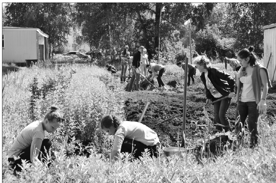
Работа трудовой бригады.

- полная оплата стоимости путевки без учета проезда в детские оздоровительные организации, расположенные на территории Республики Коми и за пределами Республики Коми, для одаренных детей (победителей и призеров республиканских, всероссийских и