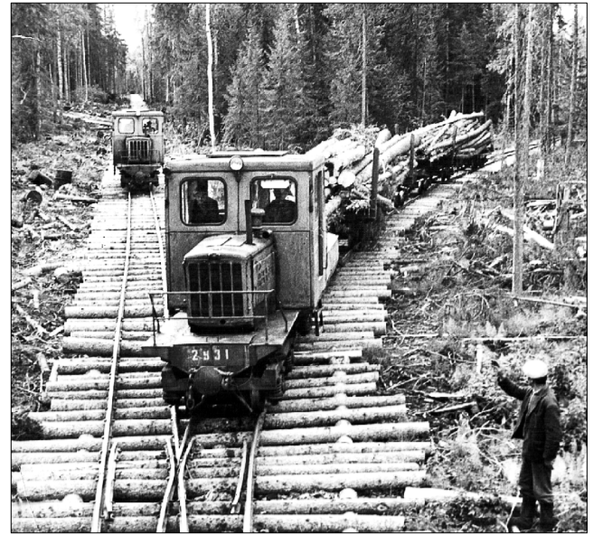
Вывозка леса по Сысольской УЖД.