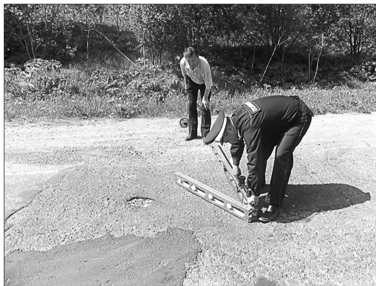
Производится замер неровностей.

Однако выявлен и ряд недостатков: на протяжении всей автодороги в некоторых местах имеются пучины дорожного полотна, просадки дороги, превышающие параметры нормативных актов. Присутствует и такой недостаток, как занижение обочины, превышающий допустимую норму. Кроме того, комиссия обнаружи-