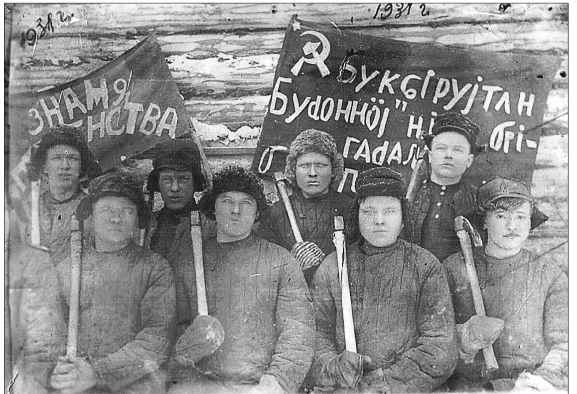
Первая бригада ударников звучников.

Любопытны данные и о годовых сезонных заданиях. Так, за сезон 1930-31 годов следовало заготовить и подготовить к сплаву 807 тысяч кубомет-