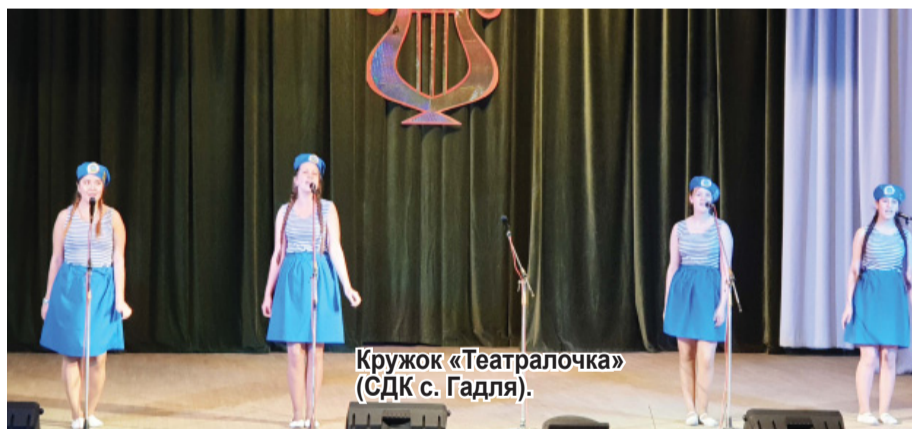
Кружок «Театралочка» (СДК с. Гадля).