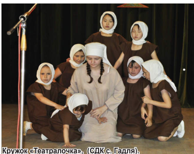
Кружок «Театралочка», (СДК с. Гадля).

Н. И. ДУБИНЕЦ , директор ООЦК.