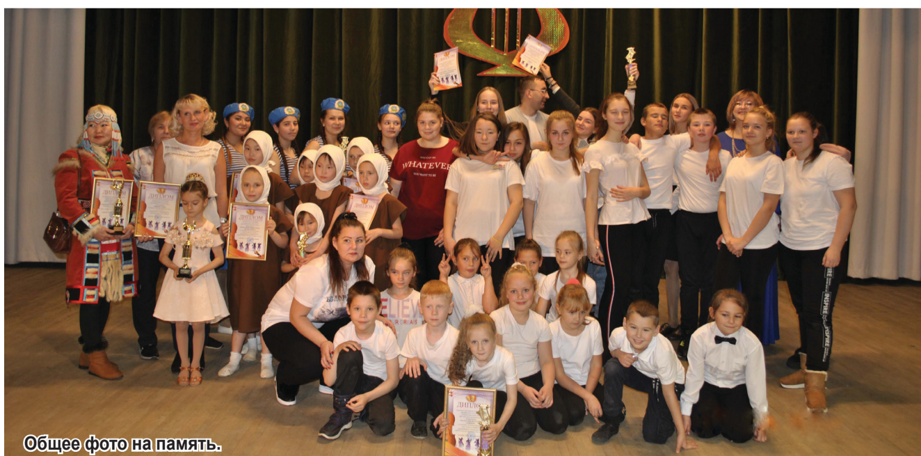
Общее фото на память.