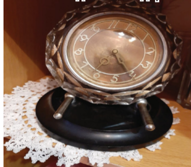
Часы - свадебный подарок.