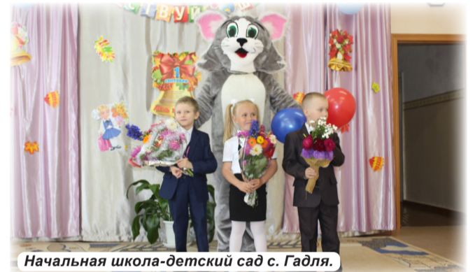
Начальная школа-детский сад с. Гадля.

Продолжил череду поздравлений отец Георгий, настоятель храма в честь