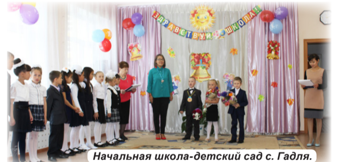
Начальная школа-детский сад с. Гадля.