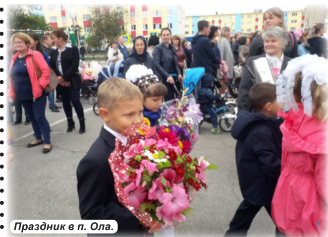
Праздник в п. Ола.