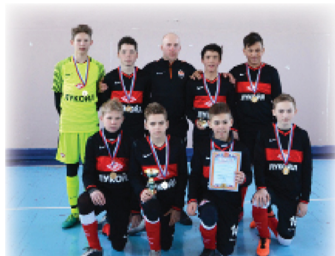
Команда-победитель «Зеленый остров».