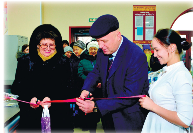
Пресс-служба МО «Ольский городской округ». Фото из личного архива А. А. БАСАНСКОГО, Олега ИЩЕНКО.