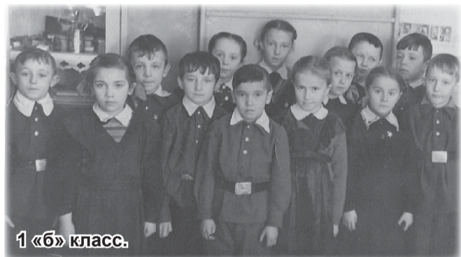
1 «б» класс.