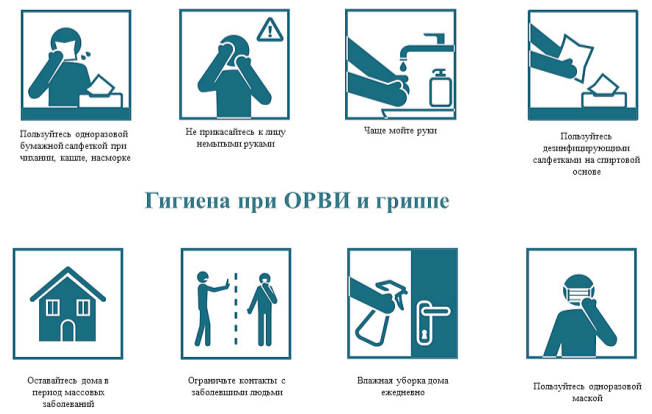
Гигиена при ОРВИ и гриппе

Соблюдение следующих гигиенических правил позволит существенно снизить риск заражения или дальнейшего распространения гриппа, коронавирусной инфекции и других ОРВИ.