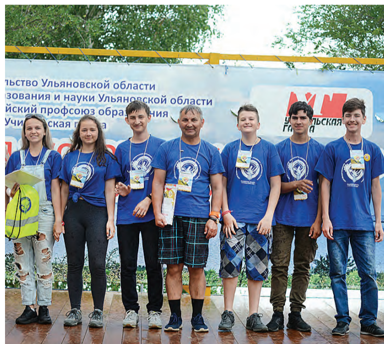
Школьники из нашего района побывали в Ульяновской области.