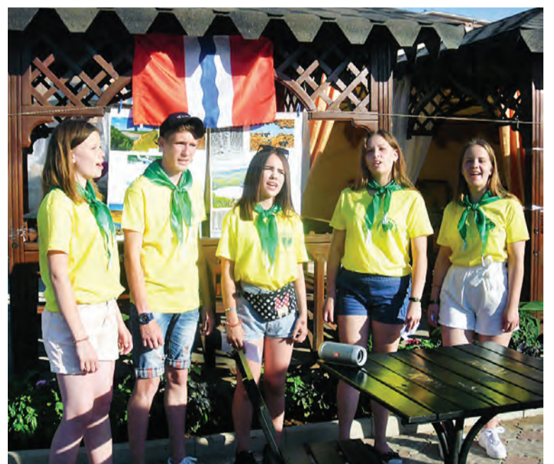
Юные степнинские экологи съездили летом в Крым.

Программа слета была очень разнообразна и насыщена различными конкурсами. В его первый день состоялась постерная презентация особо охраняемых территорий. Команда «ЭКОС» представила фото – пейзажи таежных районов, озеро Эбейты, геологический памятник природы «Берег Драверта». Во второй день предлагались мероприятия, где команды смогли проявить творческий и креативный подход к видению и решению экологических ситуаций и проблем. Каждая команда инсценировала экосказку, основная мысль которой – спасение природы и сохранение природных богатств. На суд жюри мы представили сказку «Необычный сон» о ресурсосбережении и бережном отношении к водным богатствам, а в ходе дефиле «Экомоды» продемонстрировали платье из пластиковых тарелок и ложек. Кроме того, в конкурсе презентаций особо охраняемых природных территорий своего края наши ребята показали уникальные природные объекты Омской области – государственные