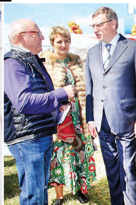
Фрагменты праздника, в ходе которого глава региона Александр Бурков оставил свой автограф марьяновцам с добрыми пожеланиями.