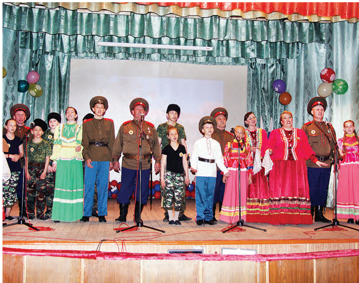
Орловские творческие коллективы - преемственность казачьей культуры.