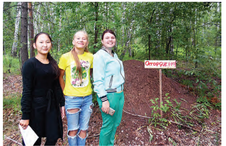
Муравейники взяты под защиту.