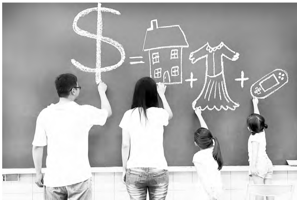
Совместный семейный бюджет предполагает общий кошелёк и финансовые цели.

Обязательно подлежат обсуждению следующие статьи: