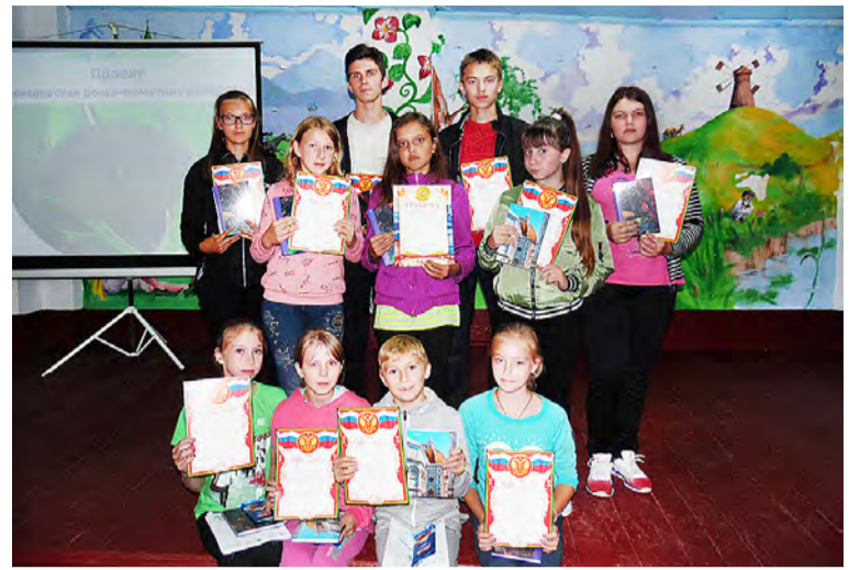
Награды участникам профильной смены.

- Профильная смена, которую организовали в нашем районном лагере, была очень интересной и веселой. Я поучаствовала в ней с большим интересом. Больше всего мне понравилась исследовательская работа и контактный зоопарк. А также я обрела много новых друзей, каждый проведенный вместе с ними день был позитивным, ярким, познавательным.