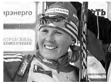
Яна Романова, биатлон.