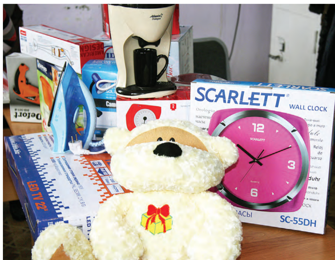
Призы ждут своих обладателей.