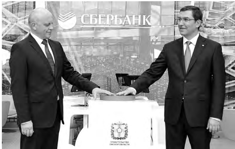
Губернатор Виктор Назаров и председатель Западно-Сибирского банка Сбербанка России Александр Анащенко на церемонии открытия центра развития бизнеса.

Президент РФ Владимир Путин заявил, что лидеры стран создали новый глобальный центр экономического развития.