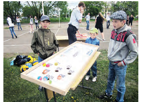
Настольные игры привлекали ребят всех возрастов.