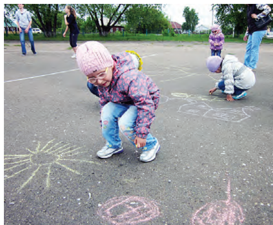
Цветными мелками на асфальте рисовали самое дорогое и светлое: дом, маму, солнышко...