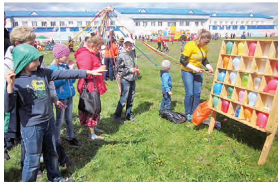
Попасть в шарик, даже не ради приза, а из интереса, хотел каждый.