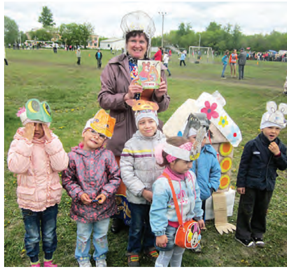
В гостях у сказки побывали малыши на игровом дворике детской библиотеки.

На эту неделю можете смело назначать переговоры с новыми деловыми партнерами, а в выходные назначать свидание - ваши усилия увенчаются успехом. Это благоприятный период, чтобы повысить свой профессионализм.