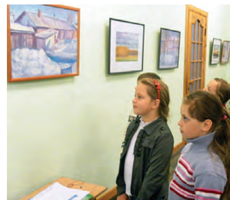
С картинами местных художников знакомятся юные марьяновцы.