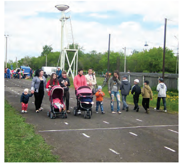
На праздник вместе с родителями собрались дети от мала до велика.