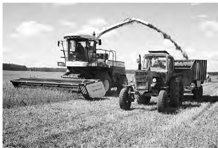
Заготовка сенажа в «Овцеводе».