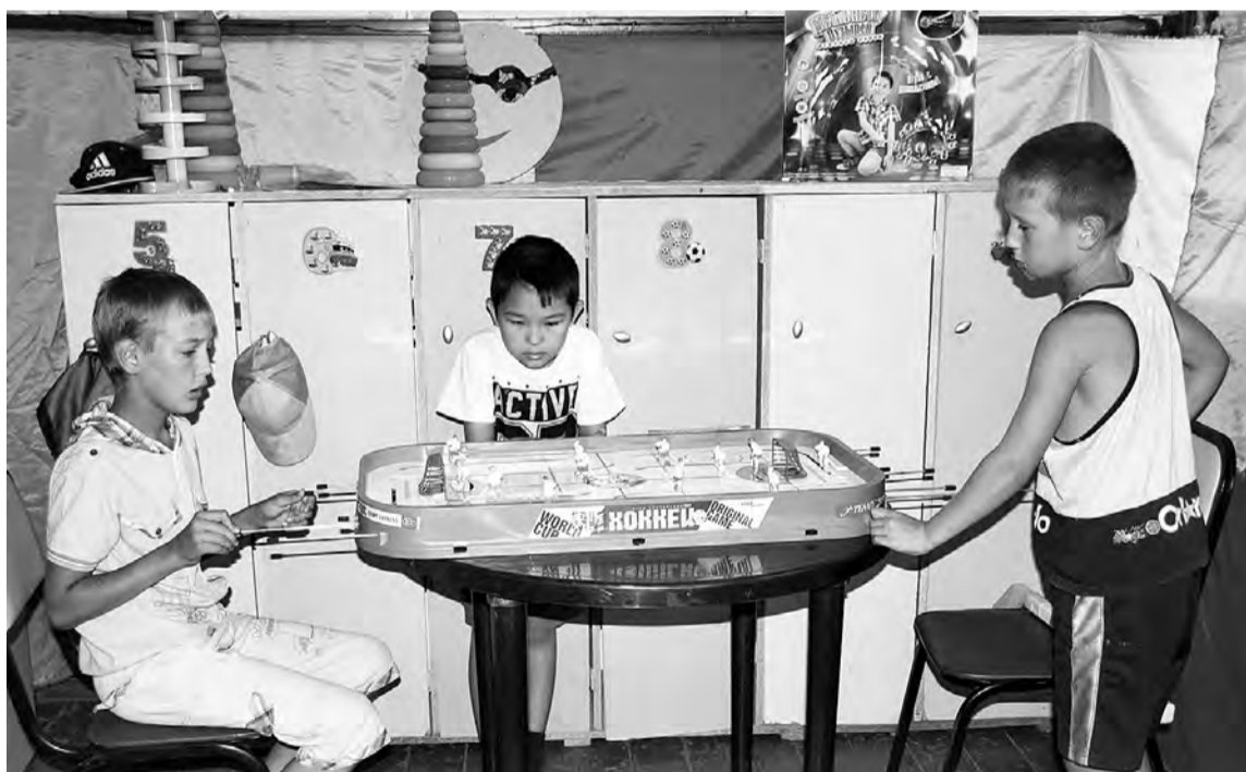
Здесь можно и в настольный хоккей сразиться...

Идеей обустройства такого местечка с хорошим игровым наполнением здесь заглялись несколько лет назад. Но финансового подкрепления для ее реализации сразу не имелось. В прошлом году заявлялись на