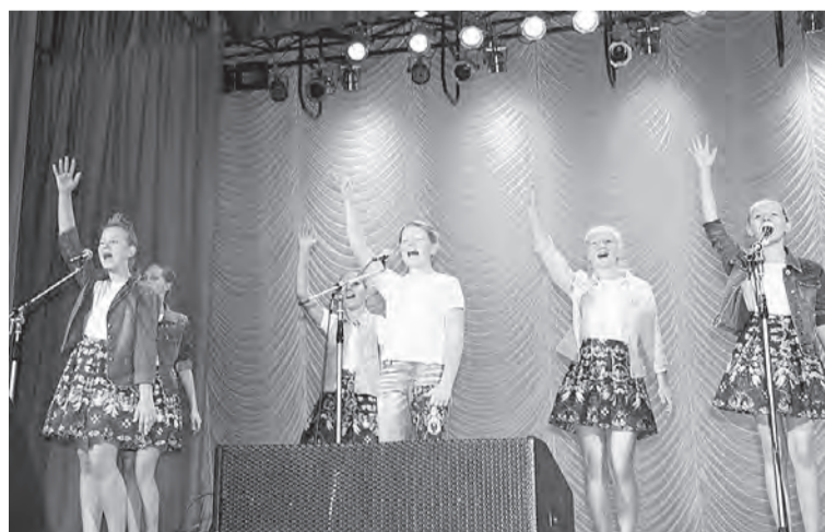
Приветствие педагогам от юных талантов.