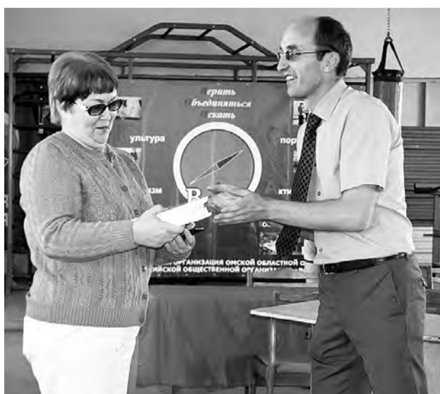
В качестве подарка - произведения местных авторов.