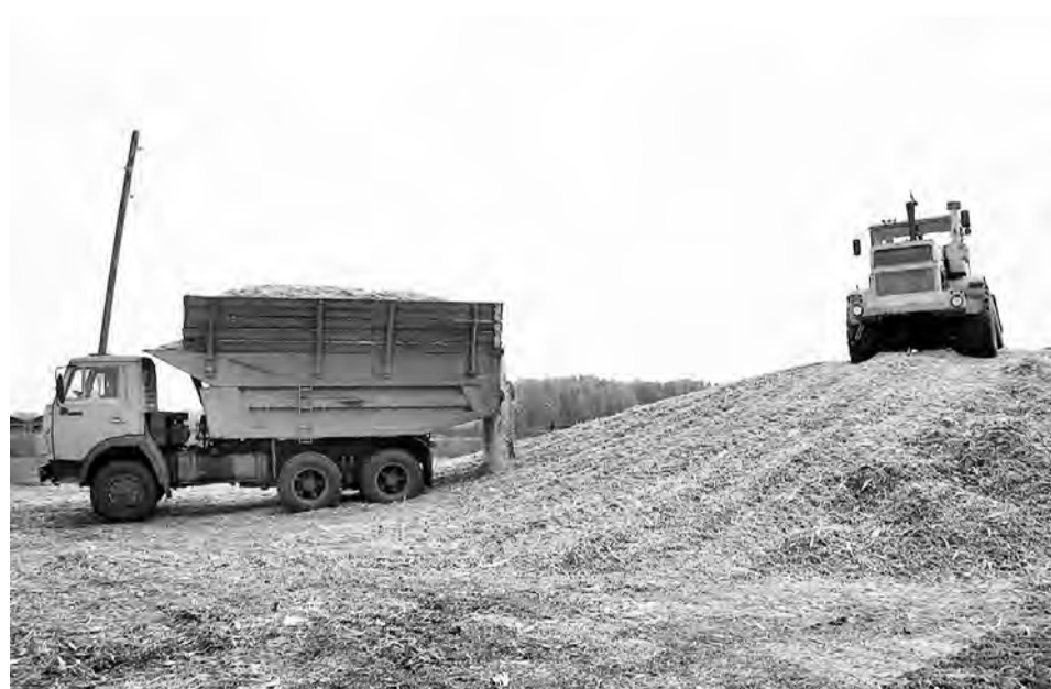
Закладка силоса в «Овцеводе».

- Благодаря добросовестности и ответственности работающих на Усовской ферме людей выполнен значительный объем: побелка, покраска, капитальный ремонт фуражного склада, в целях