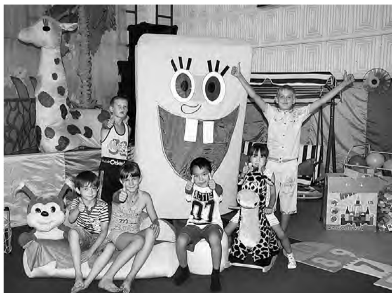
Появившуюся игровую комнату юные конезаводчане оценивают на отлично.