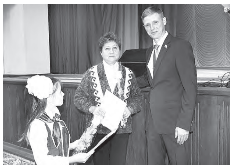
Благодарность ветеранам от Совета депутатов района.

– Я получил огромное удовольствие от участия в этом замечательном мероприятии, организованном для педагогов, от общения с ними. Сам в прошлом учитель и директор Горячеключевской средней школы Омского района с многолетним стажем, я не мог не заметить добрых, конструктивных взаимоотношений между руководством вашего района и комитета по образованию, соответственно, достигнутых результатов в развитии этой социально значимой для общества сферы. А от выступлений местных талантов – эмоции просто зашкаливают. Очень здорово!