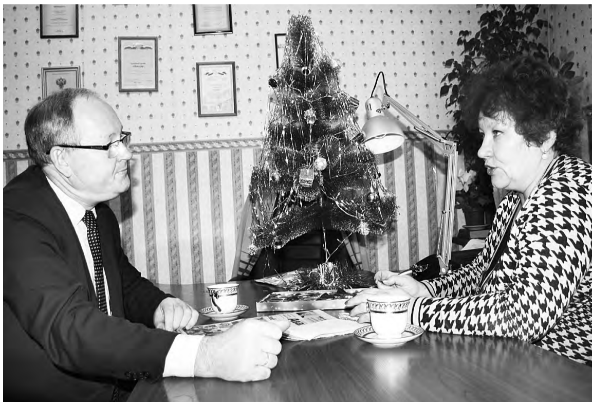
Наступающий Новый год - повод подвести итоги.

- Уверен, что каждый человек ставит перед собой определенные задачи. Вот и я, в ходе выборов 2010 года, получил немало наказов от избирателей. Прежде всего шла речь о новой команде, по большому счету - новой системе управления районом. Команда есть, система управления демократична, прозрачна, мы не закрываемся от людей. Главное - удалось преодолеть разобщенность людей и консолидировать общество. Его консолидация выразилась и в том, что выборные кампании, охватившие район с августа по декабрь, прошли в спокойной рабочей атмосфере: никто не плескал