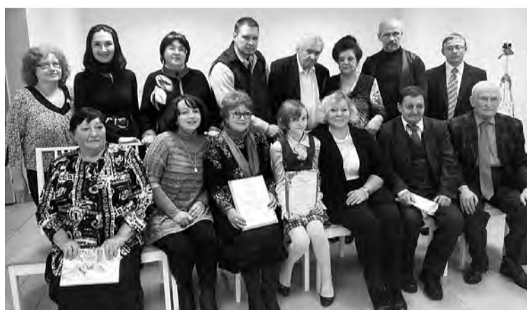
Участники Пярых Ганичевских чтений.