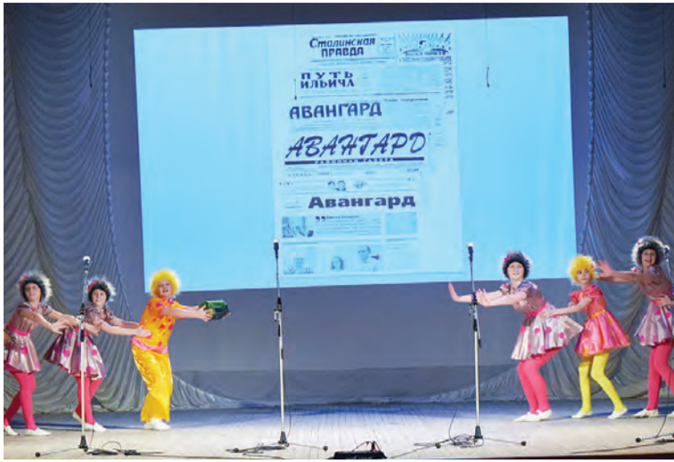
Зажигательный танец участников ансамбля «Эдельвейс».