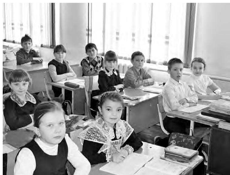
Школьные звонки будут неумолимо отсчитывать время.