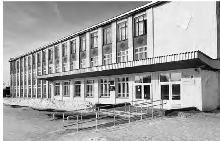
Так выглядит школа сегодня.

Налажена тесная связь с социумом, с другими образовательными учреждениями дополнительного образования – Центром детского творчества, районным Домом культуры, музыкальной школой, библиотекой, Детской юношеской спортивной школой, музеем, Худо-