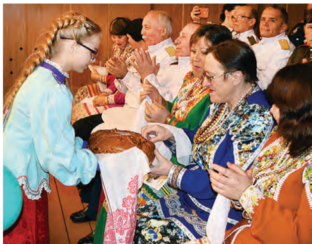
Дорогих гостей, как и повелось в старину, встречали ароматным хлебушком и солью.