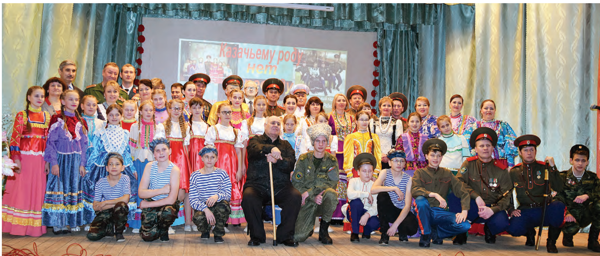
На открытии Центра казачьей культуры собрались хранители и продолжатели традиций.