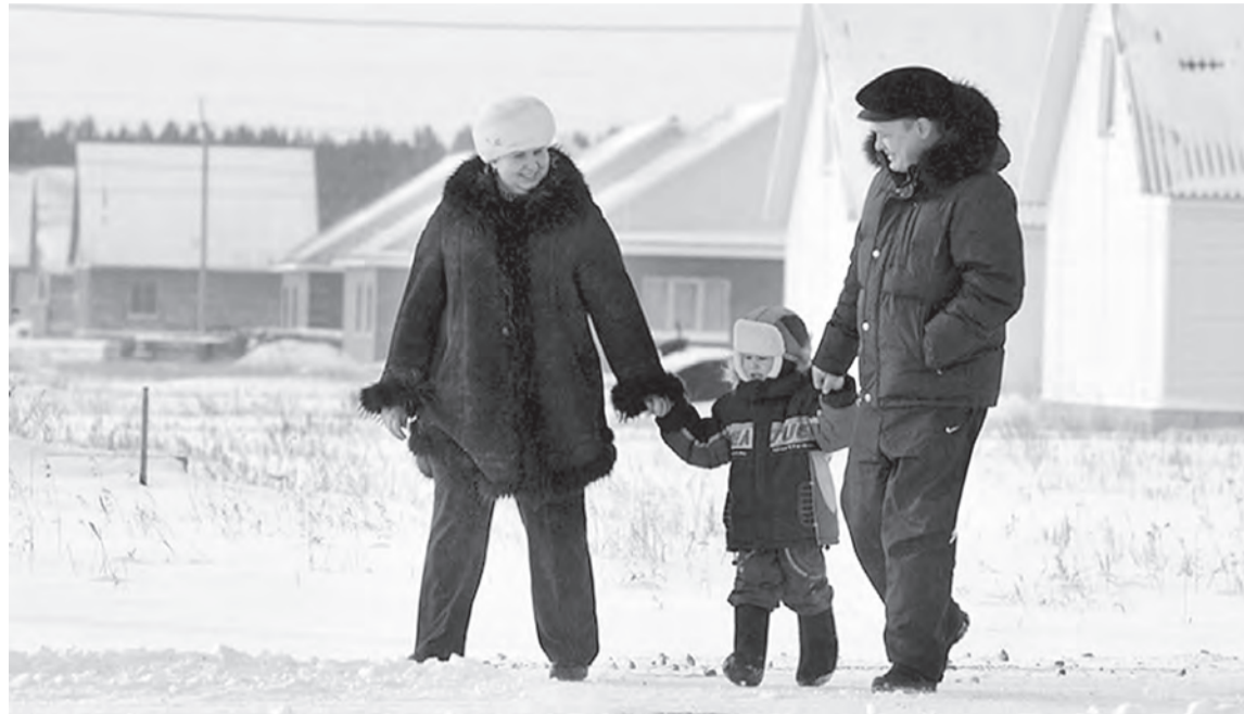
Чтобы закрепить на селе молодых специалистов, многие предприятия строят для них жилье.

В минсельхозпрод области подвели предварительные итоги Года животноводства и обсудили проблемы отрасли.