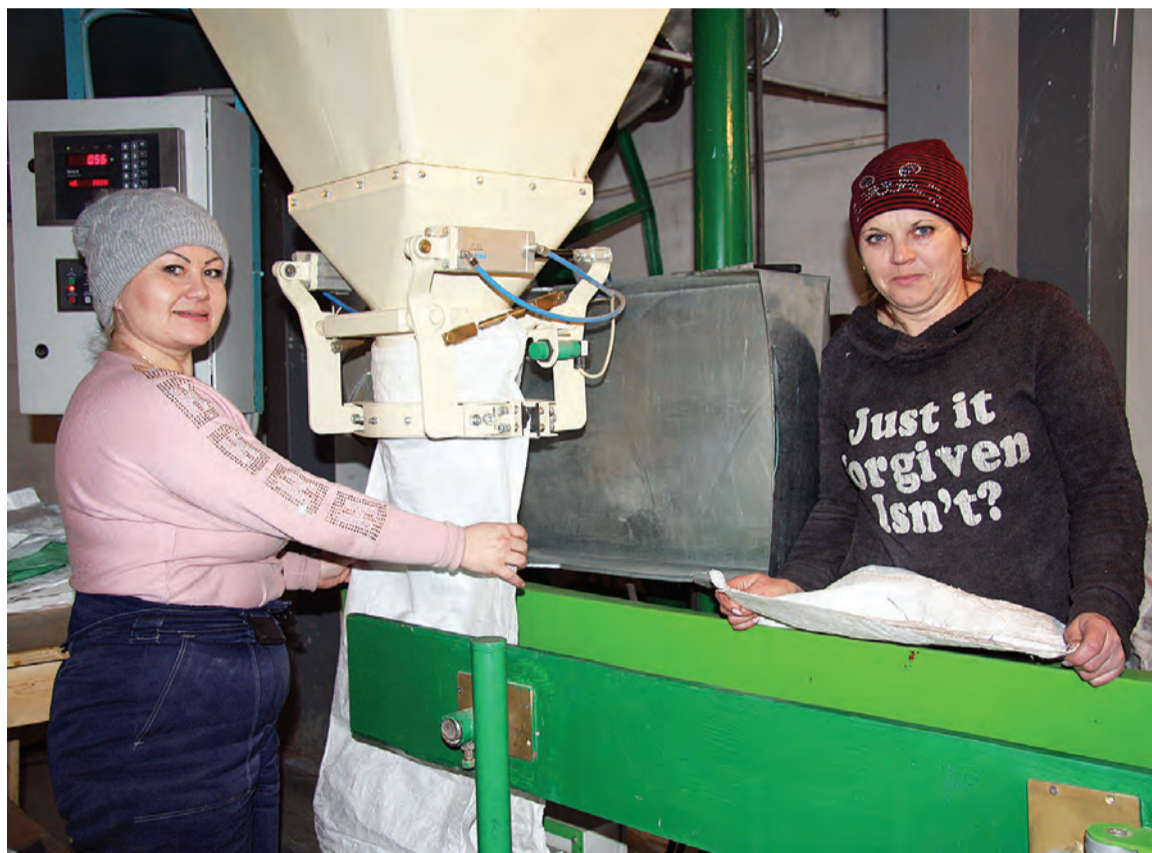
Работа фасовочной линии идет полным ходом.