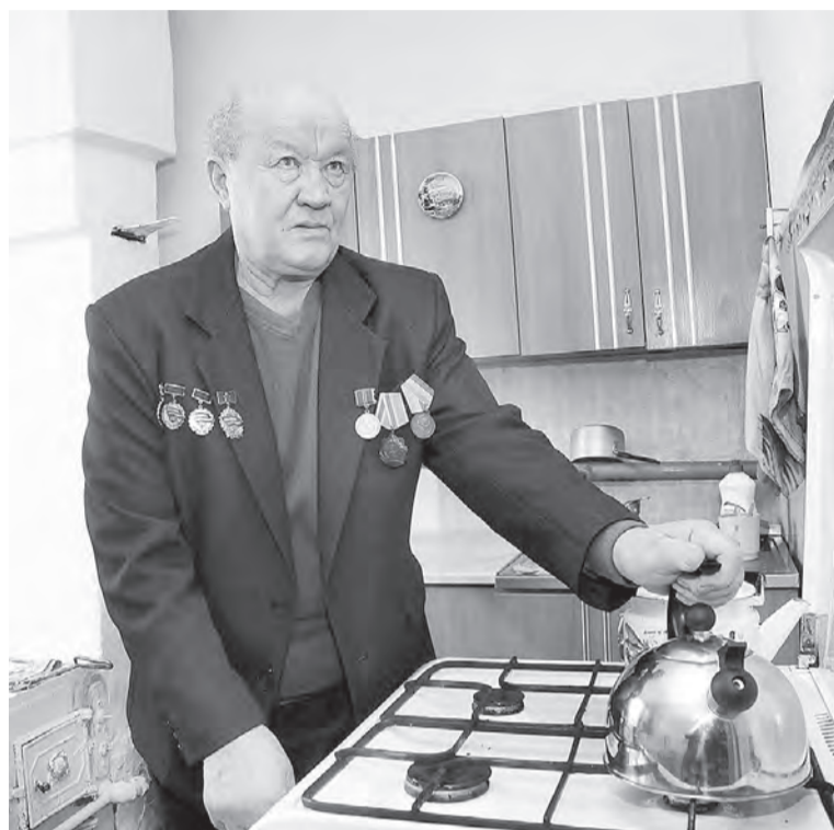
У жителей села Гринского появилась возможность провести в дома газ.

В 2018 году ожидается рост темпов строительства газопроводов в районах области.