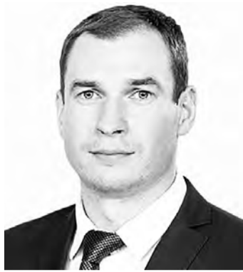
Дмитрий ПЕРМИНОВ, председатель Омской областной общественной организации ветеранов (пенсионеров), депутат Государственной Думы РФ, Герой России.

С юбилеем вас, уважаемые ветераны! Желаю всем крепкого здоровья, новых успехов в достижении поставленных целей, творчества и вдохновения в больших и важных делах!