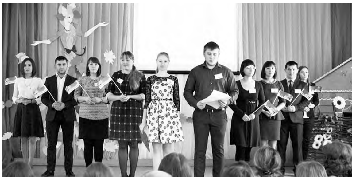
Фрагмент открытия Дня молодого педагога.