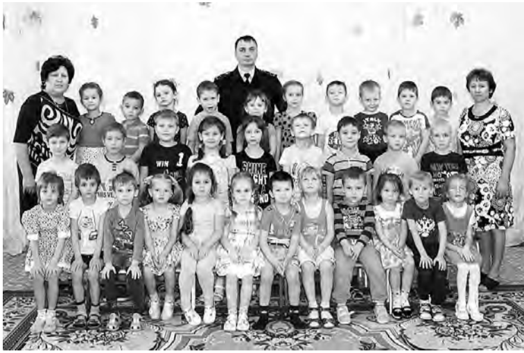
Участники тематического мероприятия по безопасности дорожного движения в Марьяновском детсаду №2.