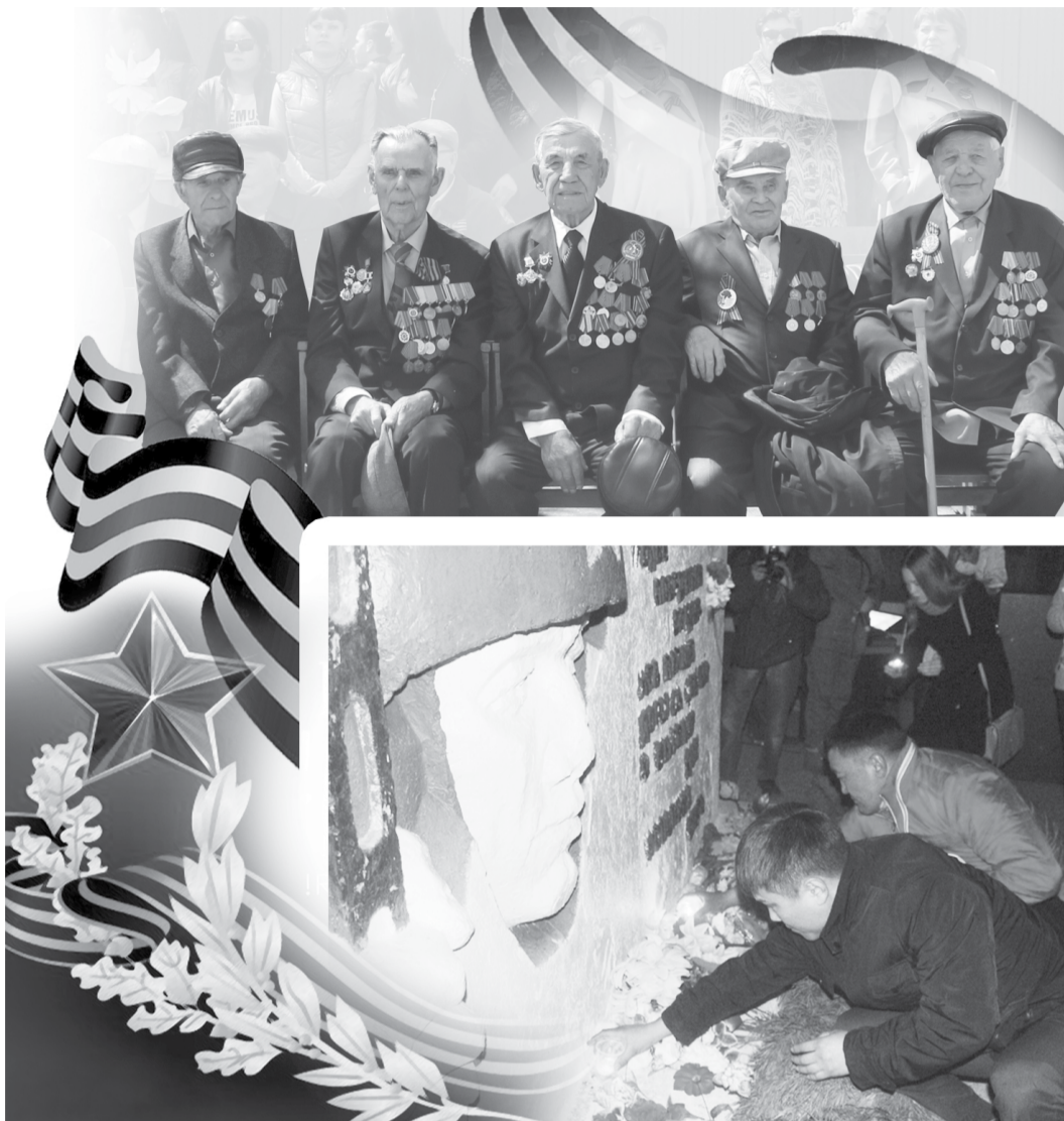
ЗАЖЖЕННЫЕ СВЕЧИ ВСЕ УЧАСТНИКИ МИТИНГА ВОЗЛОЖИЛИ У ПОДНОЖИЯ ОБЕЛИСКА

Акция «Красная звезда» - возложение цветов, дань памяти павшим. Воспитанники детского сада положили гвоздики, сделанные своими руками. Каждый из них знает о великом подвиге нашего народа из уст воспитателей, из