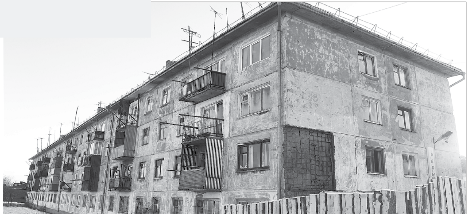
ДОСУ-203 ТРЕБУЕТСЯ РЕМОНТ

По факту отслоения фрагментов панели, была срочно созвана районная комиссия по предупреждению и ликвидации чрезвычайных ситуаций с приглашением прокурора Кяхтинского района. В оперативном порядке была приглашена экспертная организация для проведения обследования ДОСа 203 на предмет наличия угрозы здоровью и жизни жильцов данного дома, по результатам которой будет вынесено заключение – могут ли в дальнейшем жильцы проживать в этом доме. Согласно решению КЧС, отдел ЖКХ еженедельно