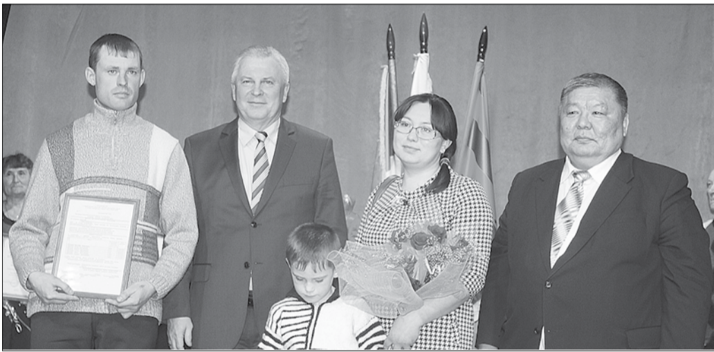
В. НАГОВИЦЫН ВРУЧИЛ СЕРТИФИКАТ НА ПОКУПКУ ЖИЛЬЯ СЕМЬЕ ЕГОРОВЫХ

Маршрут главы республики был запланирован таким образом, чтобы в ходе поездки охватить наиболее социально значимые сферы и побеседовать с разной возрастной аудиторией. Вячеслав Наговицын приехал в наш город после визита соседнего Бичурского района. Приезд его был ожидаем многими и активно обсуждаемым.