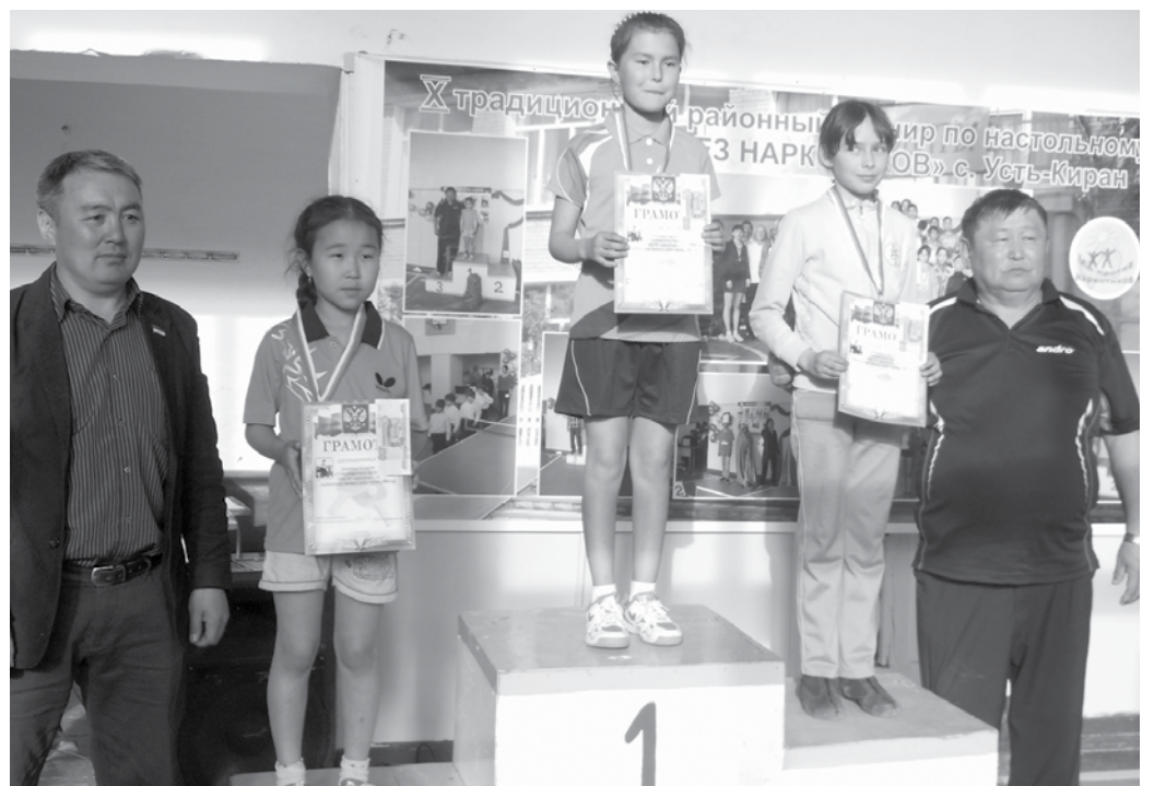
Церемония награждения на турнире по настольному теннису " Мир без наркотиков"

Х ТРАДИЦИОННЫЙ РАЙОННЫЙ ТУРНИР ПО НАСТОЛЬНОМУ ТЕННИСУ «МИР БЕЗ НАРКОТИКОВ» ПРОШЕЛ 14 МАЯ В С. УСТЬ-КИРАН.