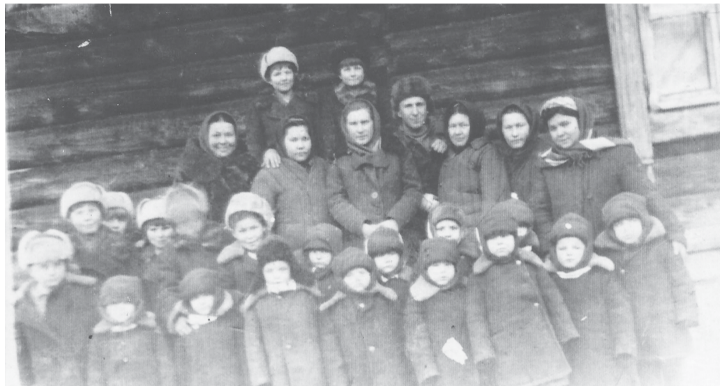
Хоринский детский дом, 1947-1948 гг.

С полным правом о себе. Год рождения 1940, а завтра была война. Все мы родом из детства. Вот только детство может быть разным. Для кого-то веселым и беззаботным, а для нас круглых сирот войны- это соленые слезы в набитую соломой подушку и матрац. Жили мы с братом у бабушки очень бедно, голодно и холодно. Питались объедками в какой-то столовой, и бабушке принесли. Дома было очень холодно спать, а однажды бабушка почему-то перестала кушать, только все спала. Чтобы согреться, мы ходили к ночегарке, где сваливался горячий шлак, там часто и засыпали. Однажды ночью нас засыпало горячим шлаком, и мы попали в больницу. Ожоговые рубцы сохранились у меня на всю жизнь. После выздоровления нас