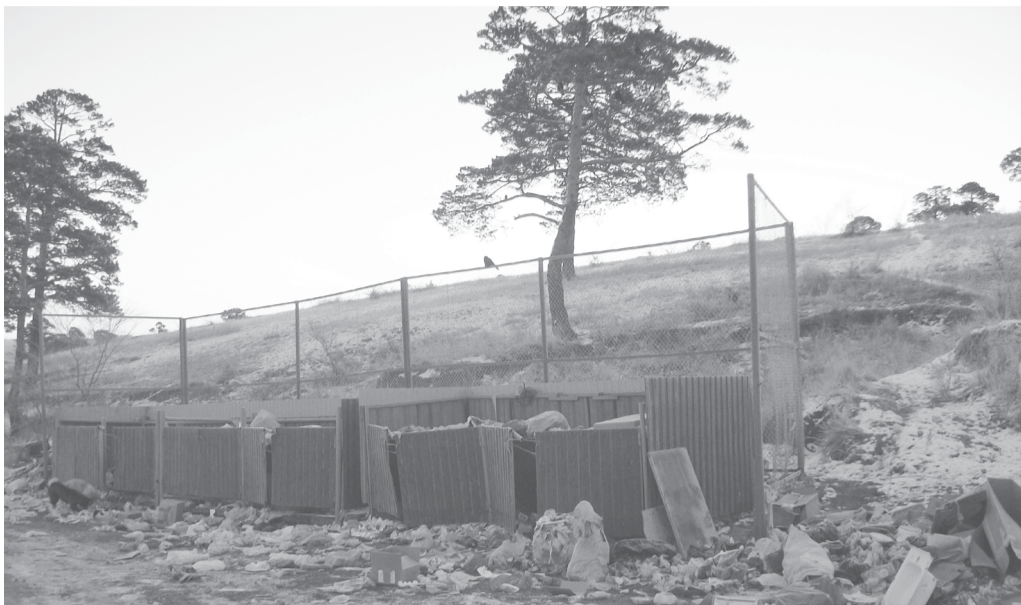
Мусорные баки в 1-м Городке.