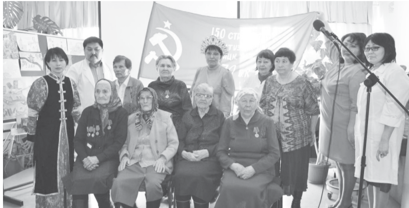
В Кяхтинской ЦРБ

Следующими эстафету приняли работники Кяхтинского противотуберкулезного диспансера.