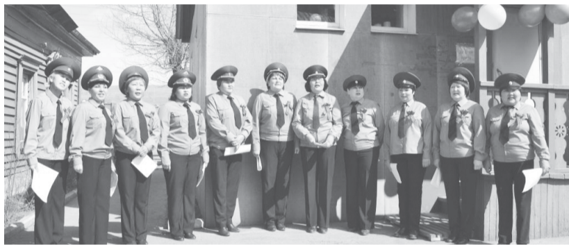
В противотуберкулезном диспансере

Встреча и передача Знамени состоялась прямо во дворе учреждения, там же прошёл импровизированный концерт. Несмотря на отсутствие времени, на огромное количество текущей работы сотрудники диспансера подготовились на славу. В современной военной форме, с георгиевскими ленточками, хор, состоящий из женщин-сотрудниц, спел все знаковые песни военных лет. Песни «Синий платочек», «Три танкиста», «Катюша» перемежались с проникновенными стихотворениями – любо-дорого было смотреть! На торжественном