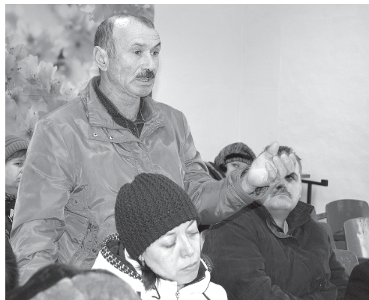
Ни один вопрос жителей не остался без ответа

На территории Сысоевского сельского поселения расположен государственный заказник «Тюльпановое поле». Растущий в заказнике тюльпан Геснера (Шренка) — редкой красоты и аромата цветок. Расположены три участка лесного хозяйства «Нижнечирский лесхоз». В х Островском лесной участок относится к зоне покоя, где запрещена охота. Здесь живут дикие кабаны, фазаны и т.д. Еще одна природная достопримечательность этой местности — курганы и лечебные камни, известные даже за пределами нашей области. Лечебные свойства пока не изучены, но сотни граждан утверждают, что избавились от недугов.