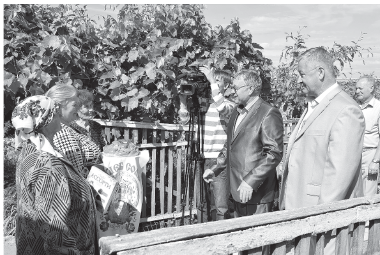
День подключения к газопроводу стал для жителей х.Синяпкинского настоящим праздником