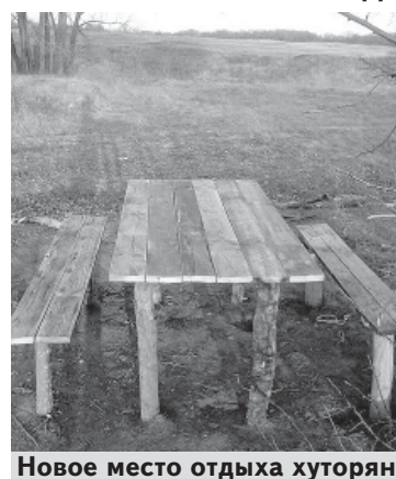
Новое место отдыха хуторян