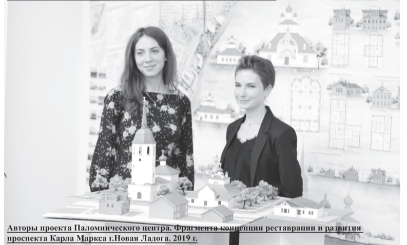
Авторы проекта Паломнического центра. Фрагмент концепции реставрации и развития проспекта Карла Маркса г.Новая Ладога. 2019 г.

Кафедра Архитектурного и градостроительного наследия СПбГАСУ