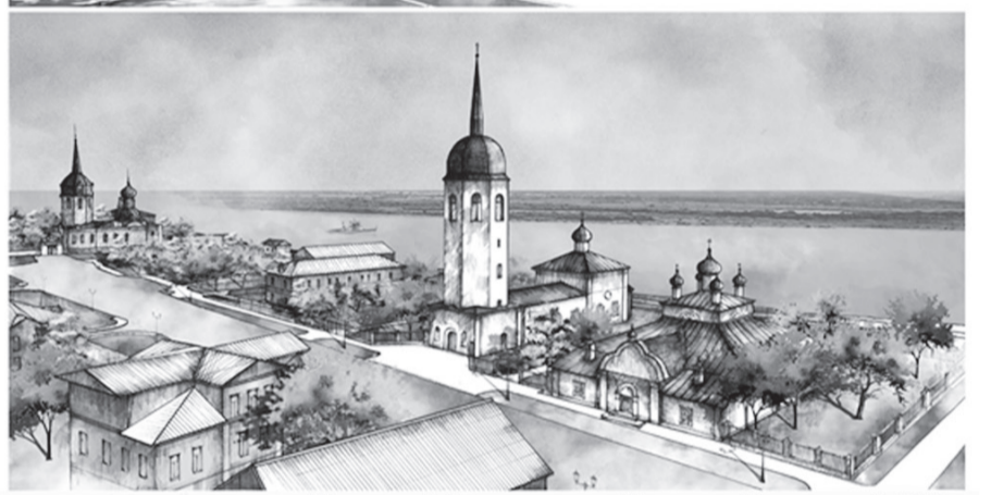
Фрагмент концепции реставрации и развития проспекта Карла Маркса в г.Новая Ладога. 2019 г.

имеющих особо важное значение для города. Такой подход позволил более пристально рассмотреть основные проблемы и предложить их решение.