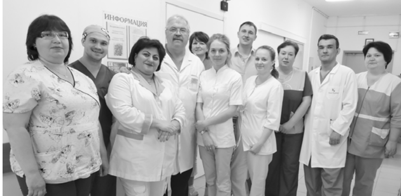
Коллектив отделения реанимации (г. Волхов)

ные или косметические ремонты за счет крупных вливаний из областного бюджета, отделения оснащены современной новой мебелью, функциональными кроватями, бытовой техникой, для детей созданы условия не только для проведения лечебных процедур, но и для игрового досуга. За последние три года преобразились поликлиника и стационар Сясьстройской районной больницы, завершён ремонт Новоладожской городской больни-