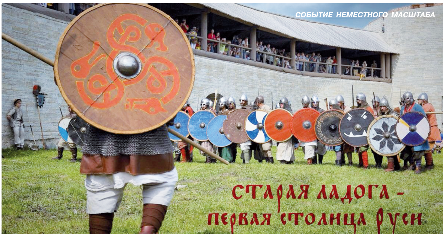
СОБЫТИЕ НЕМЕСТНОГО МАСШТАБА