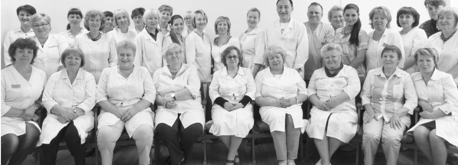
Коллектив Волховской взрослой поликлиники

назначенный для оказания медицинской помощи онкологическим больным не только из Волховского, но и из других районов Ленинградской области. Пациенты с тяжелыми и часто неизлечимыми заболеваниями получают в отделении не только специализированную помощь, включая новейшие методики обезболивания, но и помощь в оформлении документов, направлении на медико-социальную экспертизу, решении других социальных вопросов, а также основы психологической поддержки не только самих пациентов, но и их родных. Гордостью хосписа, безусловно, является отзывчивый и высококвалифицированный персонал, способный в любой ситуации помочь своим пациентам.