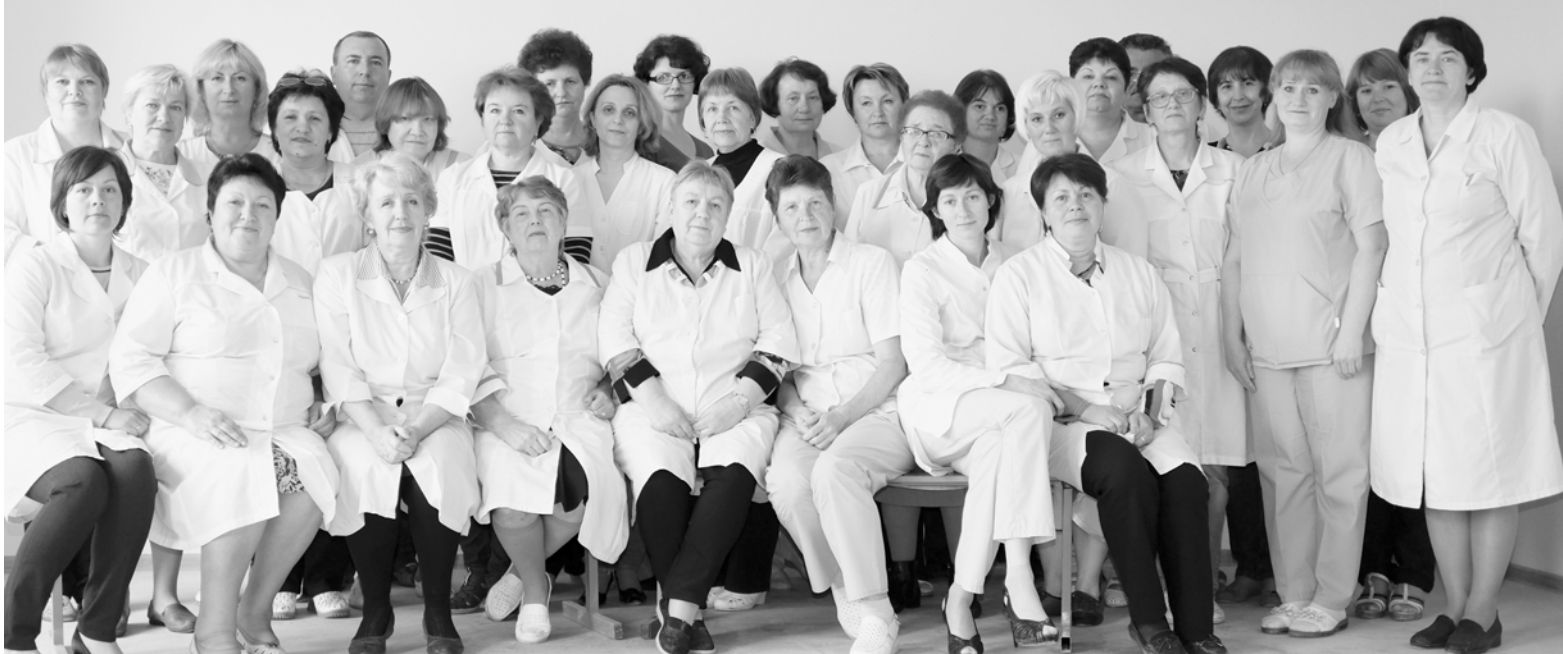
Коллектив Новоладожской поликлиники