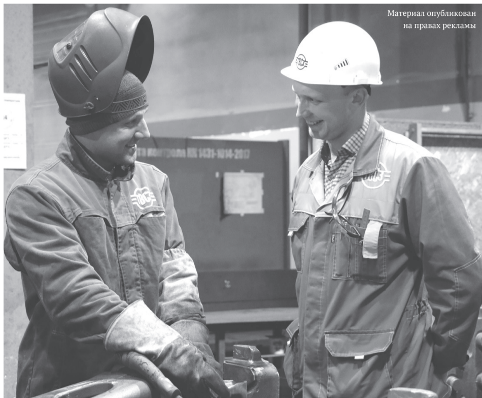
Материал опубликован на правах рекламы

Средняя заработная плата на предприятии составляет 46 тысяч рублей. Сотрудники завода работают на современном оборудовании, производство имеет высокий уровень автоматизации и роботизации. На ТВСЗ действует собственный учебный центр, осуществляющий подготовку специалистов более чем по 50 рабочим специальностям с дальнейшим трудоустройством в производственных цехах. Во время обучения выплачивается стипендия.