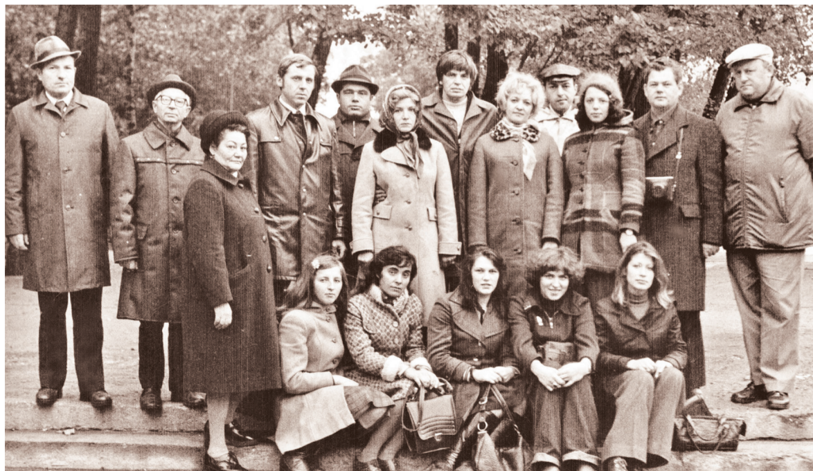
Фото: на гастролях в Польше