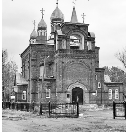
Чудово. Казанский собор

Во время Великой Отечественной войны город был 24 октября 1941 года оккупирован войсками 16-й армии вермахта в ходе Тихвинской операции. Однако менее чем через месяц в результате контрнаступления 20 ноября 1941 года он был освобождён войсками 111-й и 259-й стрелковых дивизий 52-й отдельной армии. В феврале 1942 года штаб Волховского фронта в городе Малая Вишера в качестве представителя Ставки Верховного главнокомандования посетил К.Е. Ворошилов. Сегодня это провинциальный город с населением около 12 тысяч жителей.