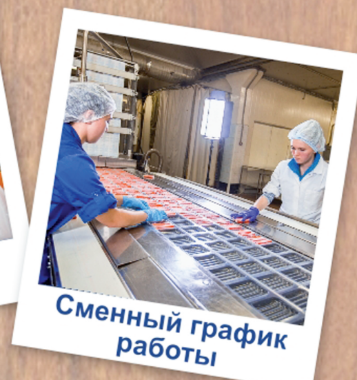
Сменный график работы

РАБОТА В РОК-1 – ТВОЁ СТАБИЛЬНОЕ СЕГОДНЯ