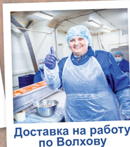
Доставка на работу по Волхову