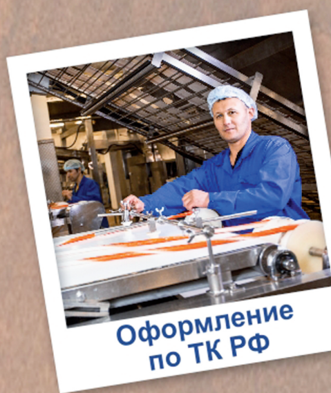
Оформление по ТК РФ

УКЛАДЧИКИ УПАКОВЩИКИ РЫБНОЙ ГОТОВОЙ ПРОДУКЦИИ ОТ 25 000 РУБЛЕЙ