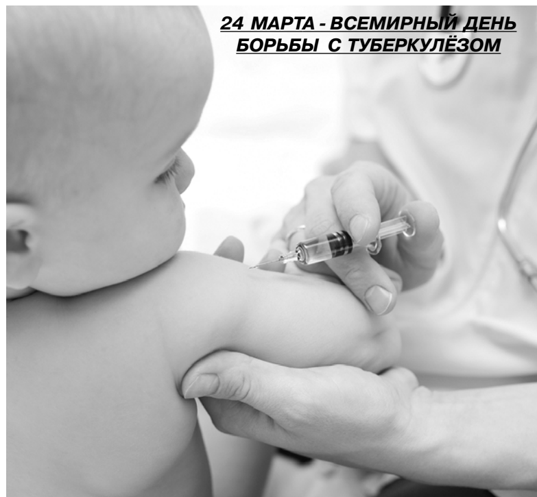
24 МАРТА - ВСЕМИРНЫЙ ДЕНЬ БОРЬБЫ С ТУБЕРКУЛЁЗОМ

Туберкулёз - это хроническое инфекционное заболевание человека и животных, вызываемое микобактериями туберкулёза. Основные клинические проявления заболевания (кашель, мокрота, кровохарканье и истощение) были описаны ещё Гиппократом и Авиценной. Но и сегодня во всём мире от туберкулёза умирает людей больше, чем от всех инфекционных заболеваний, вместе взятых.