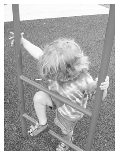
Материалы подготовлены информационным центром Волховской МБ

Специалистами подготовлено очень много памяток о безопасном доме, ПДД, поведении с незнакомыми людьми и так далее. Но нельзя забывать и о личной ответственности родителей, ибо за жизнь и здоровье своих детей отвечают в первую очередь они.