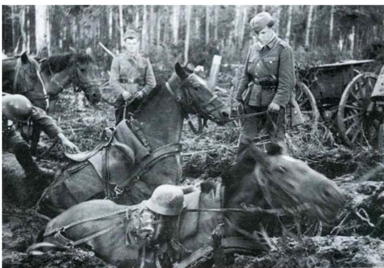
bis an Ihre Leiber versanken die Pferde im zähen Wolchow-Schlamm in den Urwald-Sumpfwäldern 1942