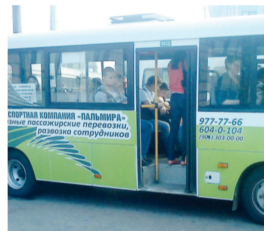
Подготовил Игорь БОБРОВ

С 7 июня до Кисельни организован еще один временный рейс в 12-30 по маршруту №64А.