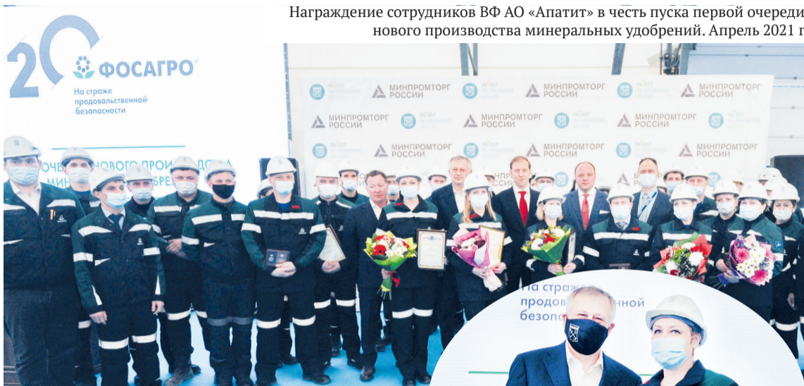
Награждение сотрудников ВФ АО «Апатит» в честь пуска первой очереди нового производства минеральных удобрений. Апрель 2021 г.