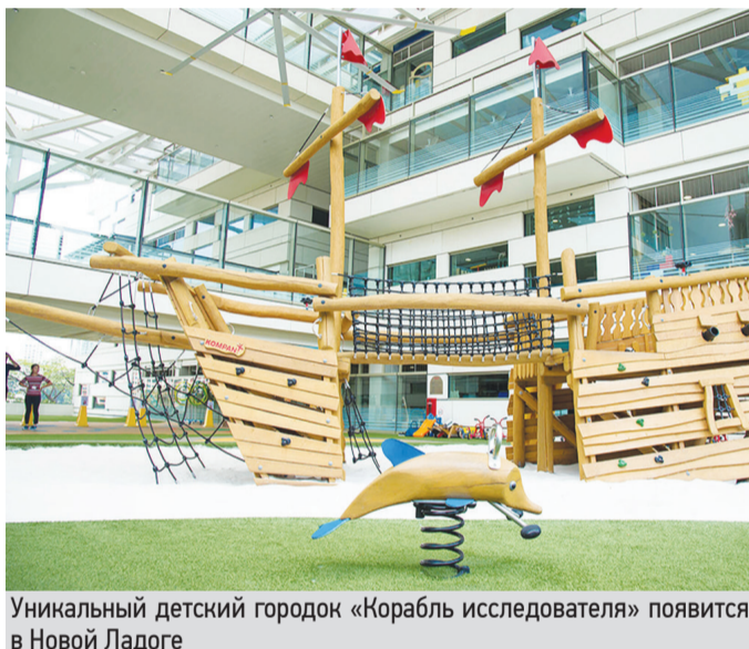
Уникальный детский городок «Корабль исследователя» появится в Новой Ладоге

Вообще благоустройство города начала прежняя администрация с