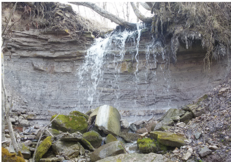
Вода, пещеры, острова...

А начать бы мне хотелось с водопадов, самый впечатляющий из которых, если не считать водосливную плотину Волховской ГЭС, находится в Горчаковщине. Вернее, там относительно недалеко друг от друга располагаются сразу два водопада - Большой и Малый Горчаковщинские.