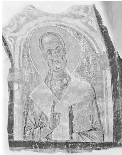
Фреска Георгиевского собора в Старой Ладоге. Посл. четверть XII в.

В жизни есть много исторических личностей, которых помнит мир. Но, наверное, нет в мире ни одного человека, который бы не знал о подвиге Святителя Николая. Божьего Угодника Николая Чудотворца православные христиане очень почитают, и память Его совершают два раза в год - 19 декабря и 22 мая.